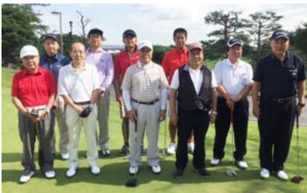
9月14日ゴルフ部コンパ